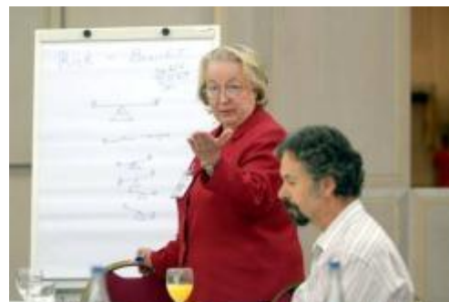
Desarrollo de Capacidades